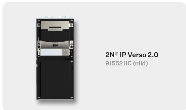
2N® IP Verso 2.0 9155211C (nikl)