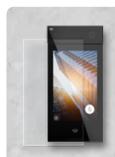
2N® IP STYLE ANTIBAC (PODPORUJE ZABEZPEČENÉ KARTY)