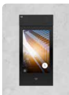
2N® IP STYLE (PODPORUJE ZABEZPEČENÉ KARTY)