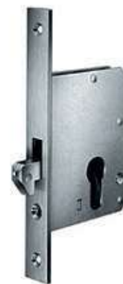
Hákový zámek 1112